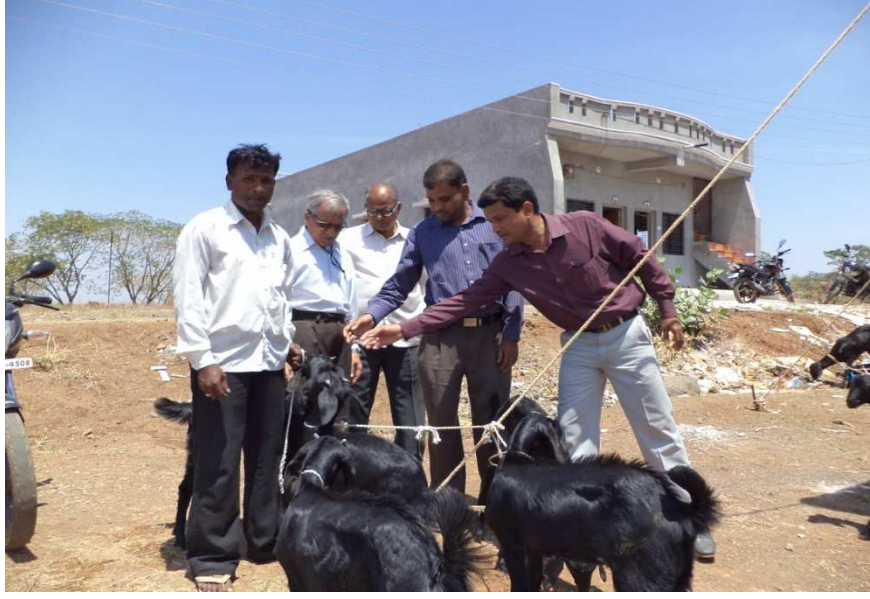
TDP प्रकल्पांतर्गत भुमीहिन शेतकऱ्यांना शेळी हस्तांतरण