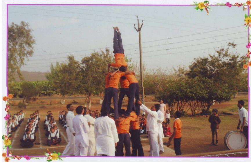
प्रजासत्ताक दिनी आश्रमशाळेच्या प्रागणात मनोरे सादर करतानां विद्यार्थी