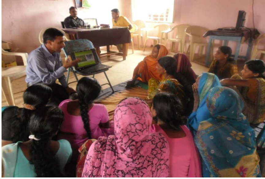
ग्रामीण महिलांना आधुनिक तंत्रज्ञानाचे प्रशिक्षण