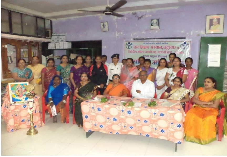
जन शिक्षण संस्थान तर्फे आयोजित 8 मार्च महिला दिनाच्या कार्यक्रमास उपस्थित महिला