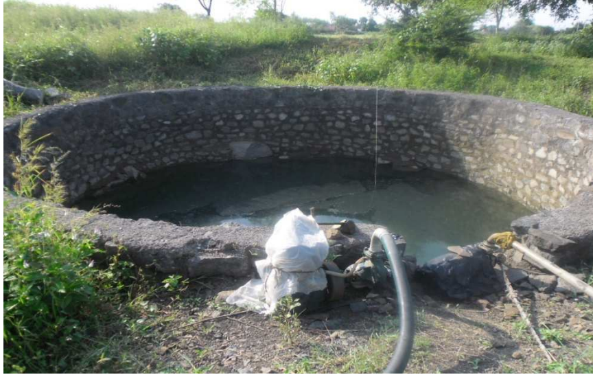
NAIP प्रकल्पांतर्गत विहीर खोलीकरण