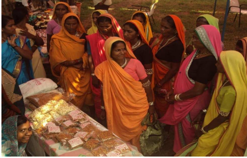
कृषि तंत्रज्ञान महोत्सवास बचत गटाची भेट