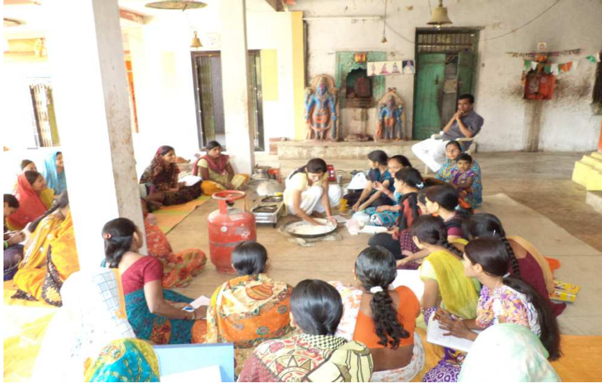
जन शिक्षण संस्थान तर्फे महिलांना व्यावसायिक प्रशिक्षण