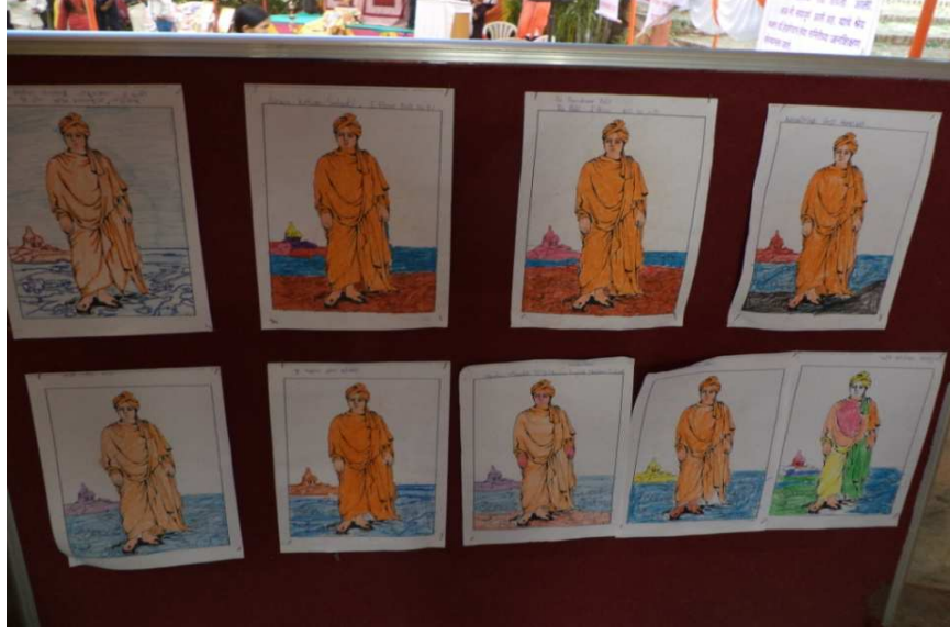
मृद्गंध- रंगभरा कार्यक्रमात चिमुकल्यांनी रंगवलेले छायाचित्र