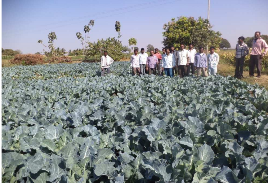
NAIP प्रकल्पांतर्गत शेतकऱ्यांनी केलेली भाजीपाला लागवड