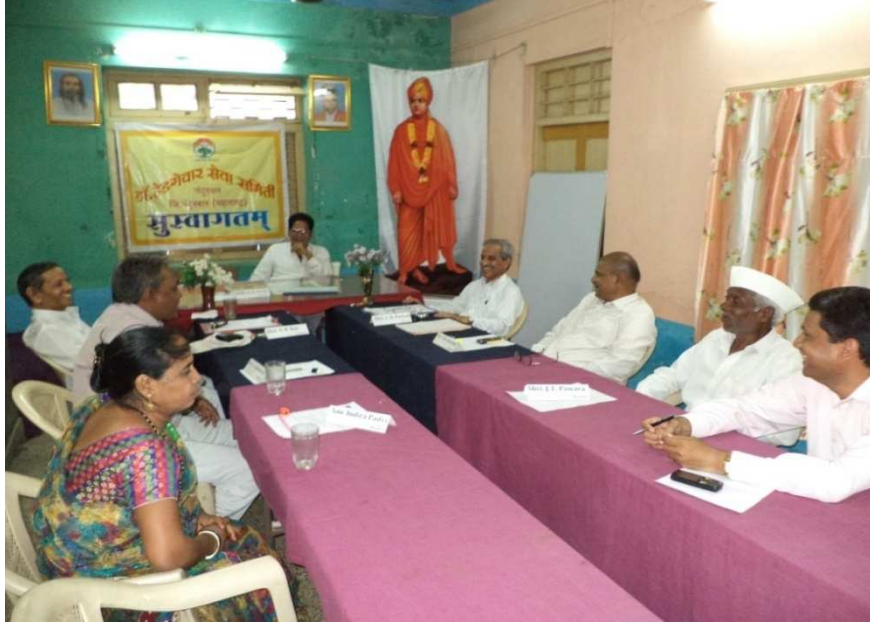
संस्था कार्यकारिणी बैठकीत उपस्थित विश्वस्त