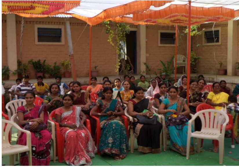
मृद्गंध कार्यक्रमास उपस्थित भगिनी