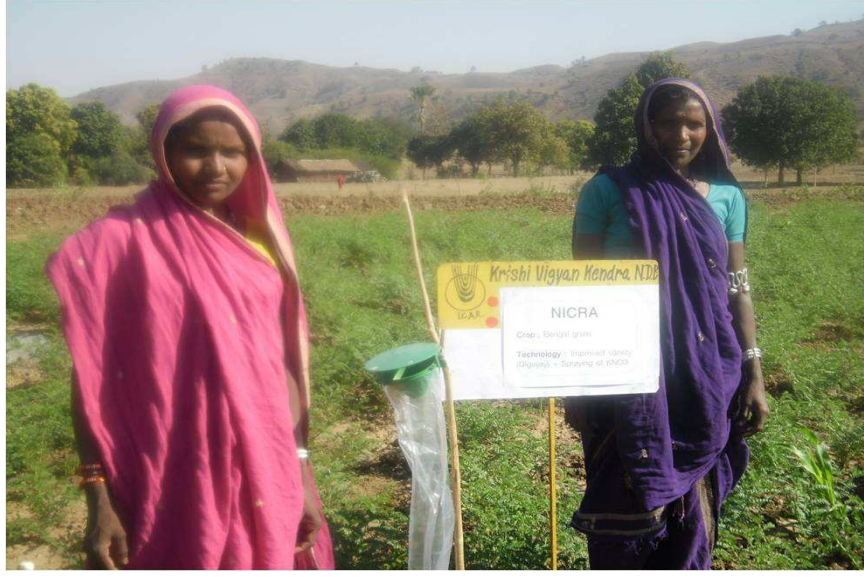
NICRA प्रकल्पांतर्गत महिला शेतकरी