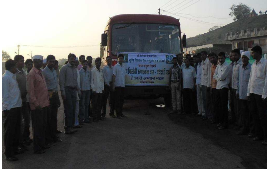
Lead Crop अंतर्गत शेतकऱ्यांची अभ्यास सहल