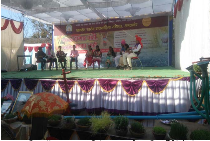
बाल साहित्य संमेलनाच्या एका परिसंवादात इ. 7वी च्या विद्यार्थीनीने घेतलेला सहभाग