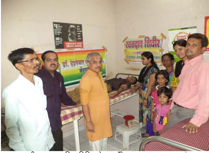
जागतीक रक्तदाता दिना निमित्ताने ब्लडबँकेत जाऊन रक्तदान करतांना