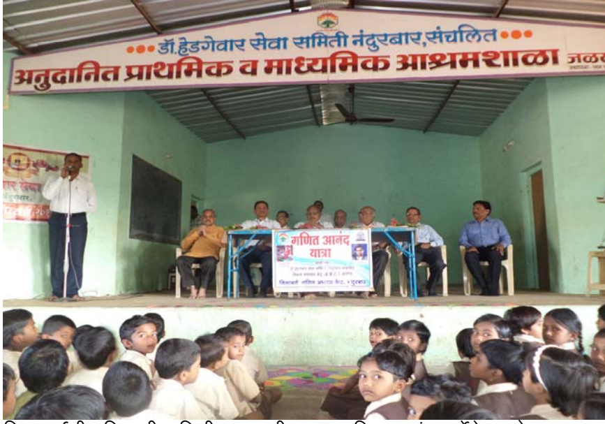
विद्यार्थ्यांची गणितातील भिती दुर व्हावी म्हणुन गणित आनंद यात्रेचे आयोजन