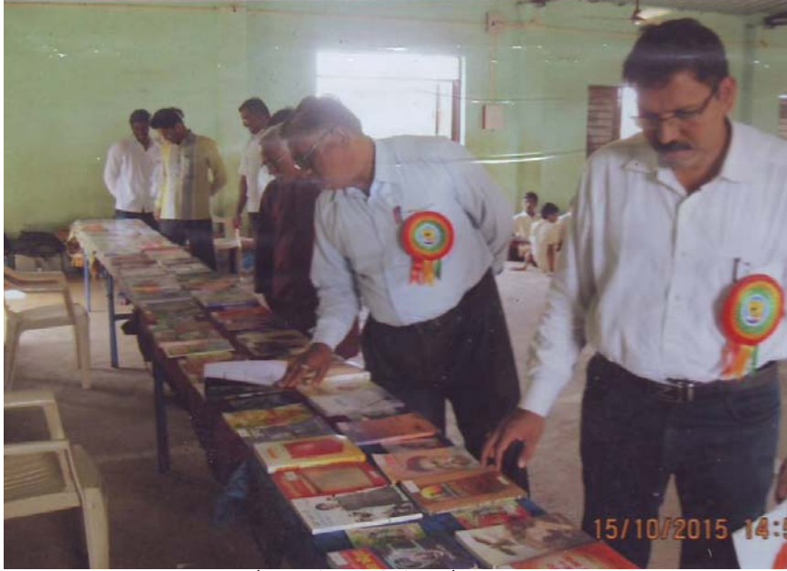
वाचन प्रेरणा दिवसानिमित्ताने पुस्तक प्रदर्शन