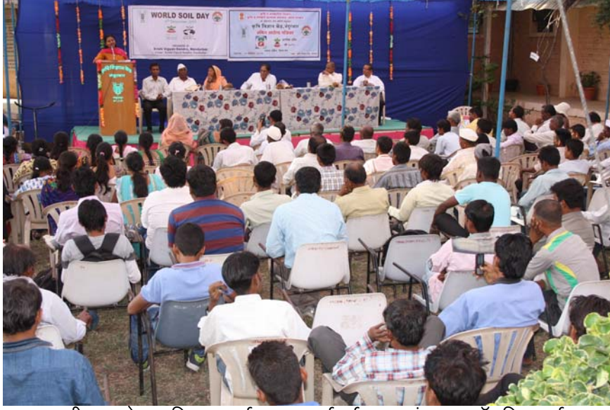
जमीन आरोग्य पत्रिका कार्यक्रमस मार्गदर्शन करतांना मा. डॉ. हिनाताई गावित, खासदार नंदुरबार