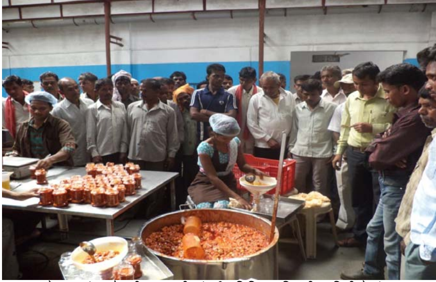
शेतकऱ्यांना शैक्षणिक सहली अंतर्गत विविध युनिटची माहिती देतांना